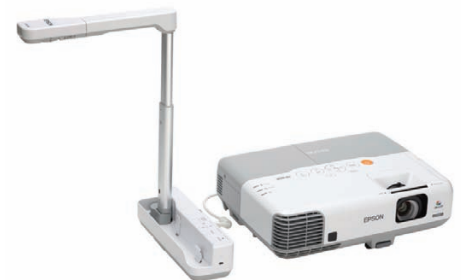
Prostřednictvím vizualizéru ELP-DC06 můžete sdílet trojrozměrné předměty